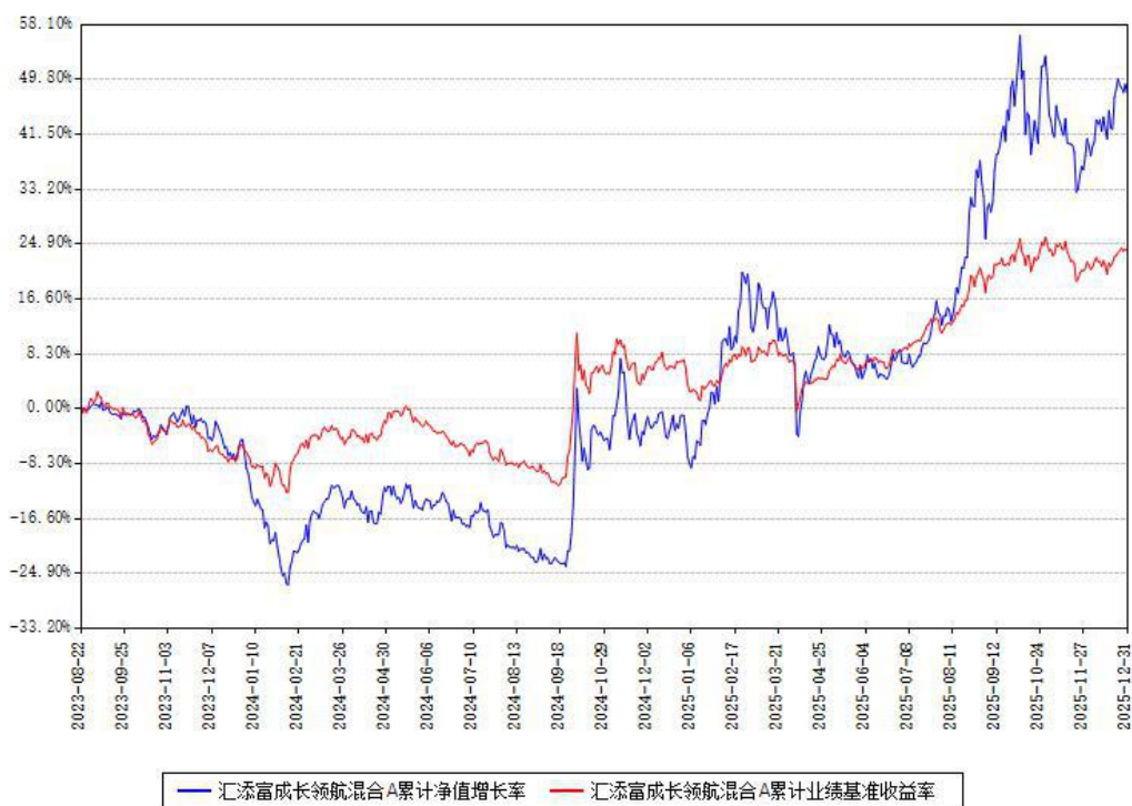
汇添富成长领航混合A累计净值增长率与同期业绩基准收益率对比图