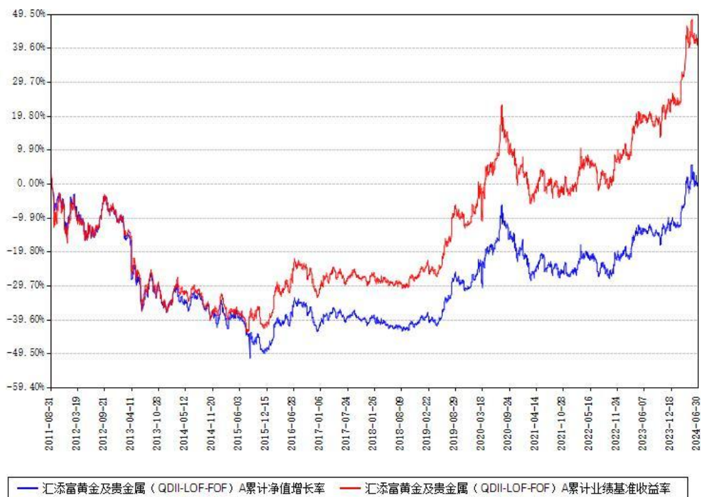
汇添富黄金及贵金属（QDII-LOF-FOF）A累计净值增长率与同期业绩基准收益率对比图

2、自基金合同生效以来基金累计净值增长率变动及其与同期业绩比较基准收益率变动的比较图