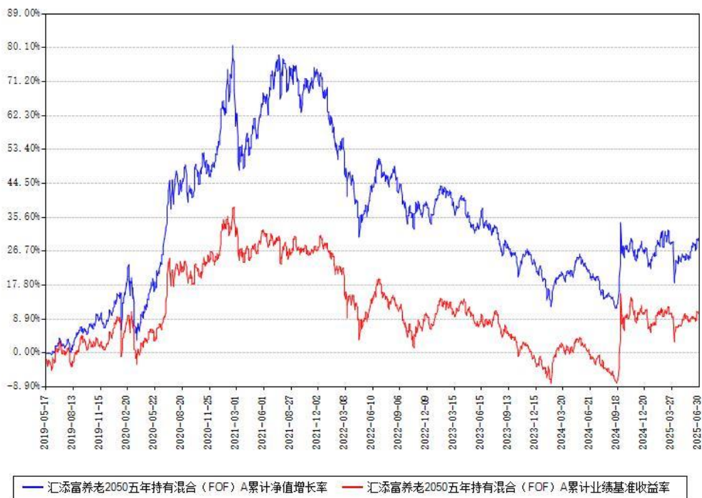
汇添富养老2050五年持有混合（FOF）Y累计净值增长率与同期业绩比较基准收益率对比图